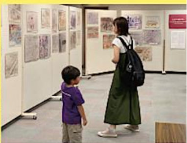
原簿絵画展を息子と見学 (来年も開催を応援します)