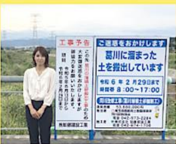
高麗川、越辺川、葛川の合流地点近くで (水害対策はこの地区最大の課題です)