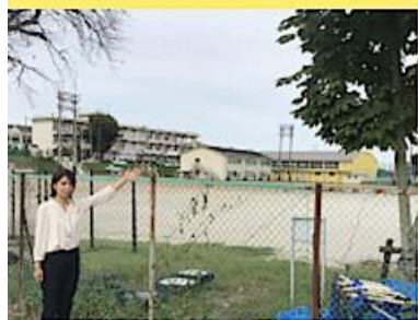
若宮中学校の校塚アオギリ2世 (市内公共施設への植樹を進めます)