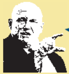
アーミテージ元国務副長官